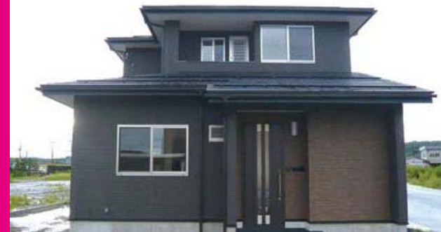
広い洗面所、収納の工夫等暮らしやすさを追求した住まいです。