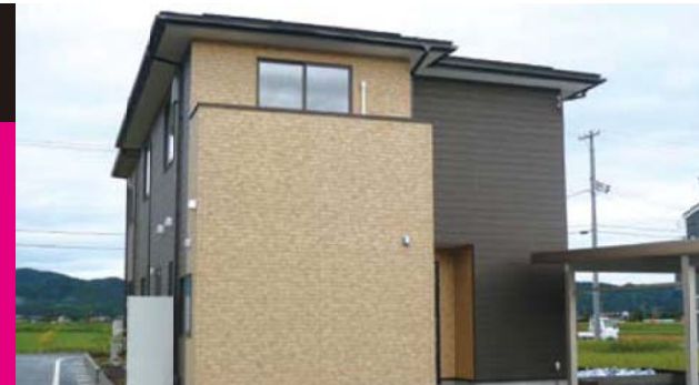
ペット対応や防音施工など豊かな暮らしを追求した住まいです。